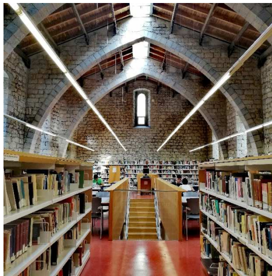
Clarissa F, Universidad de Girona, Spagna, a.a. 2019/2020

TIROCINIO: può essere aggiunto purché patrocinato dall'ateneo ospitante, inserito nell'OLA e di durata massima di 2 mesi