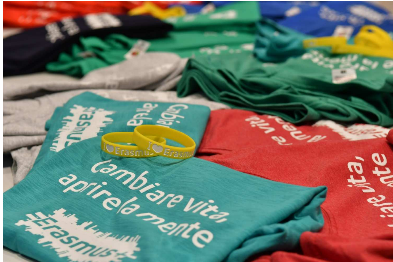
Foto scattata in occasione degli Erasmus Days 2019