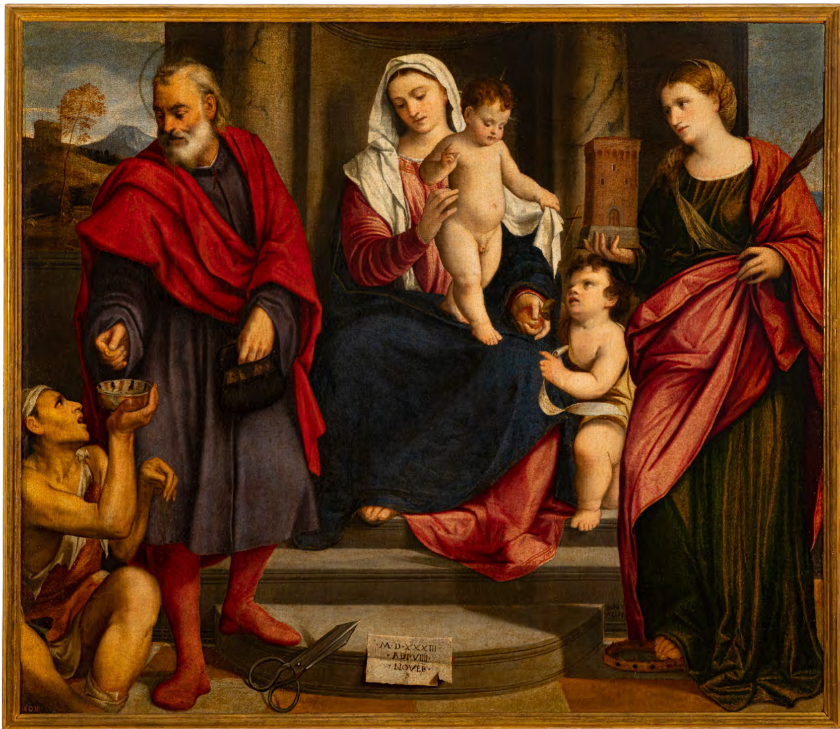
Bonifacio De' Pitati, Madonna col Bambino e san Giovannino tra i santi Omobono e Barbara