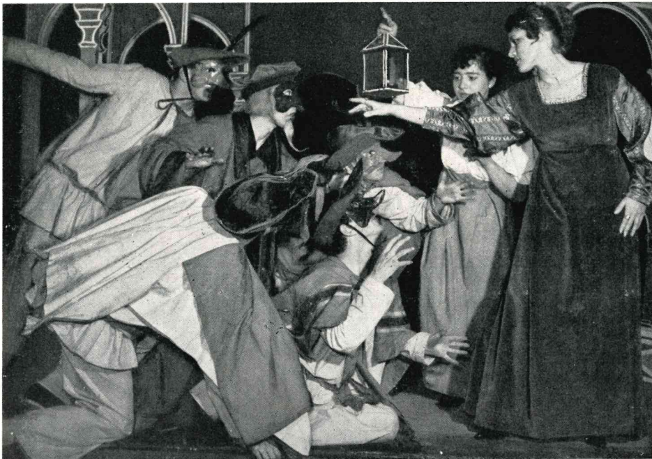
La scena della lotta contro le pulci in un tono eroicomico. Il ritmo dei versi conduce il gesto che, senza esserne sopraffatto, diviene simbolo della parola. E' questa una delle scene di maggiore successo dell'opera.

Il secondo tempo comprende, invece, documenti teatrali già scenicamente definiti, la cui messinscena abbisogna, più che di una creazione, di una vera e propria interpretazione scenica. Lo spettacolo si chiude con « Lo Anfiparnaso » di Horatio Vecchi, per la sola parte letteraria, con il quale s'intende indicare la decadenza e insieme la confluenza della Commedia dell'Arte nella pastorale e nel melodramma secentesco. In sostanza lo spettacolo, oltre che una rievocazione fantastica del mondo delle maschere cinque-sulle base di autentici scritti dell'epoca, illustra scenicamente lo sviluppo — culturalmente evolutivo e artisticamente involutivo, se rapportato colla vigoria e la plasticità dei personaggi alle loro origini — delle maschere e del teatro popolare italiano, dai primi contrasti ingenui e infantili, ma pieni di un grande vigore espressivo e di una straordinaria vis comica, soffusi di un clima quasi surreale e attuantisi in forme ritmiche assolutamente stilizzate, sino a costruzioni sceniche organicamente