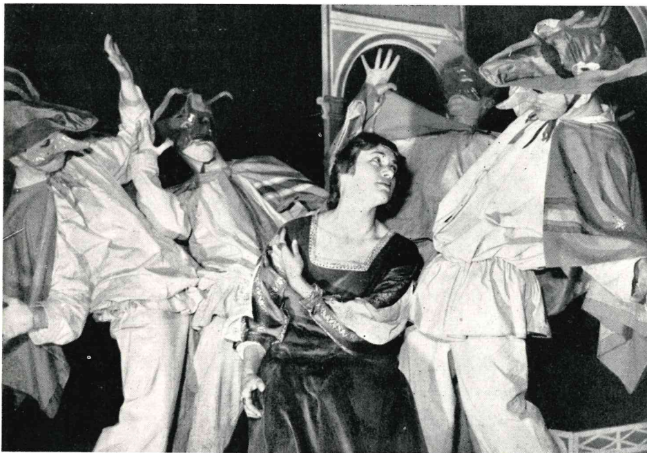
Un particolare della scena delle pulci. I sei Zanni vestono un costume stilizzato che si esprime puramente per rapporti tonali di colore.

Il secondo tempo comprende, invece, documenti teatrali già scenicamente definiti, la cui messinscena abbisogna, più che di una creazione, di una vera e propria interpretazione scenica. Lo spettacolo si chiude con « Lo Anfiparnaso » di Horatio Vecchi, per la sola parte letteraria, con il quale s'intende indicare la decadenza e insieme la confluenza della Commedia dell'Arte nella pastorale e nel melodramma secentesco. In sostanza lo spettacolo, oltre che una rievocazione fantastica del mondo delle maschere cinque-sulle base di autentici scritti dell'epoca, illustra scenicamente lo sviluppo — culturalmente evolutivo e artisticamente involutivo, se rapportato colla vigoria e la plasticità dei personaggi alle loro origini — delle maschere e del teatro popolare italiano, dai primi contrasti ingenui e infantili, ma pieni di un grande vigore espressivo e di una straordinaria vis comica, soffusi di un clima quasi surreale e attuantisi in forme ritmiche assolutamente stilizzate, sino a costruzioni sceniche organicamente