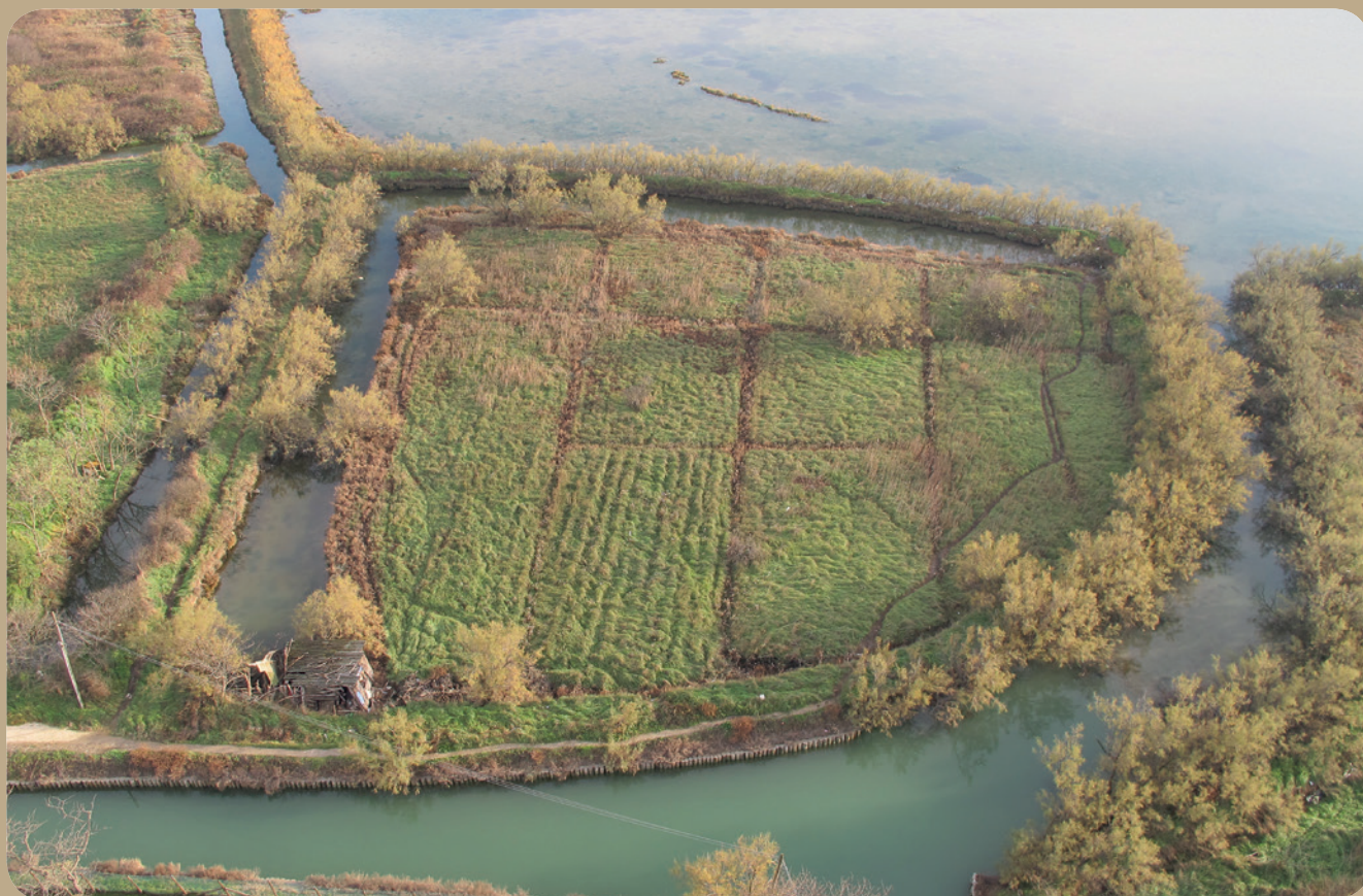
Fig. 8 - Torcello, vista dal campanile (D. Calaan)