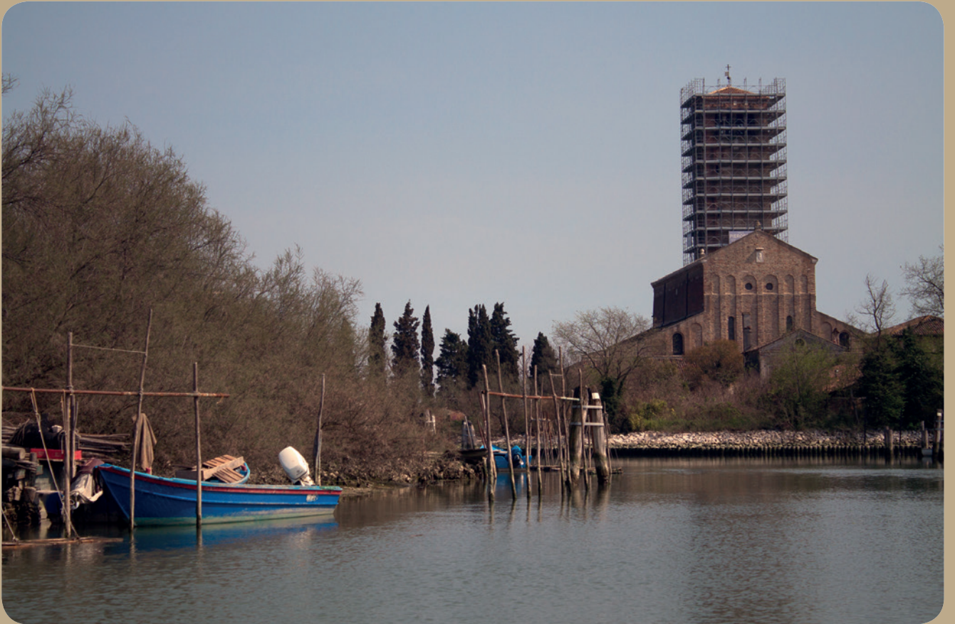
Fig. 2 - Santa Maria Assunta, vista dal canal Grande di Torcello (A. Corazza)