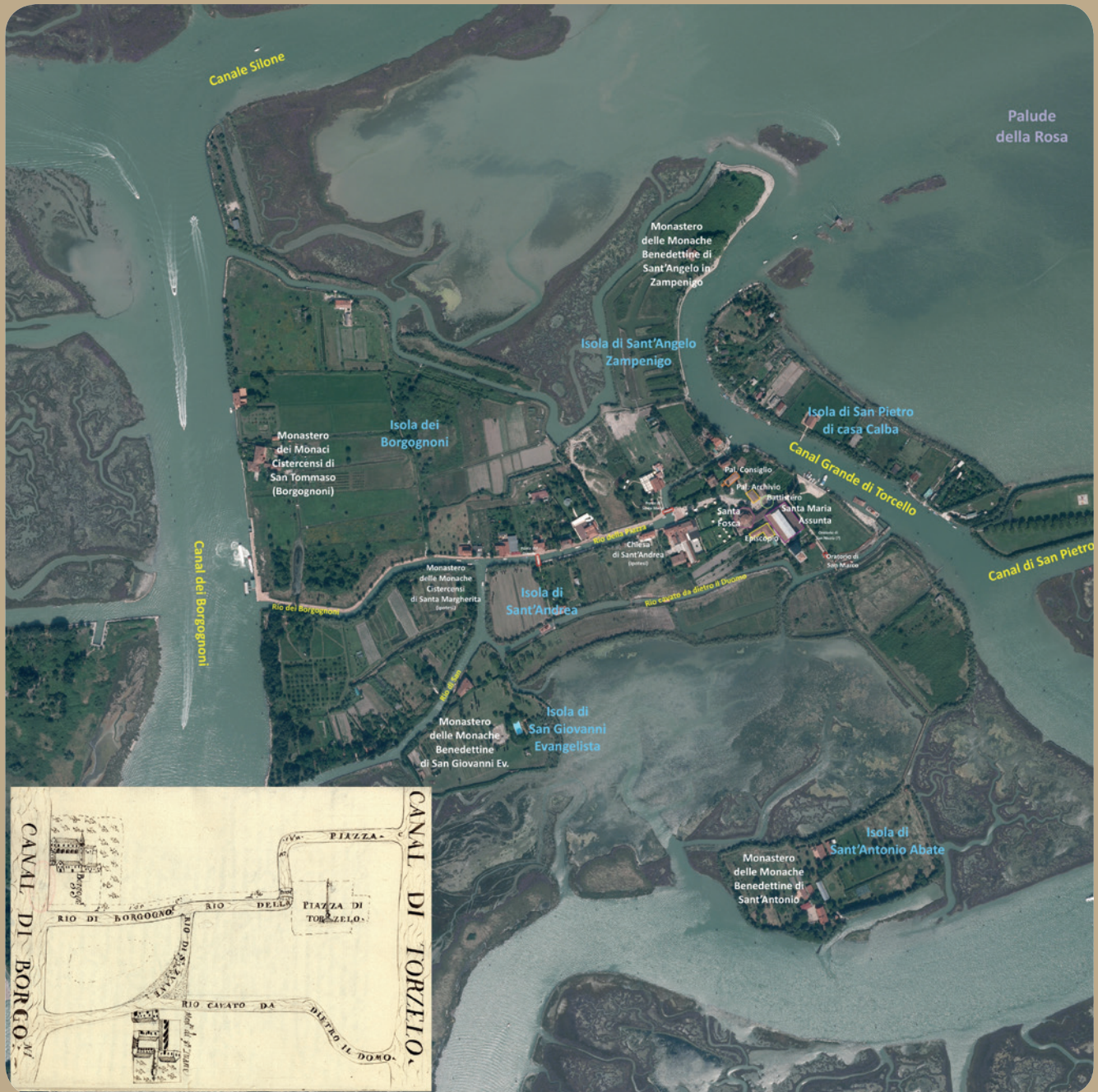
Fig. 1 - Torcello, localizzazione dei monasteri basso medioevali e mappa antica del 1688 (D. Caloon. Regione Veneto, Sezione Pianificazione Territoriale Strategica e Cartografia e CALAON 2013a, pag. 82)