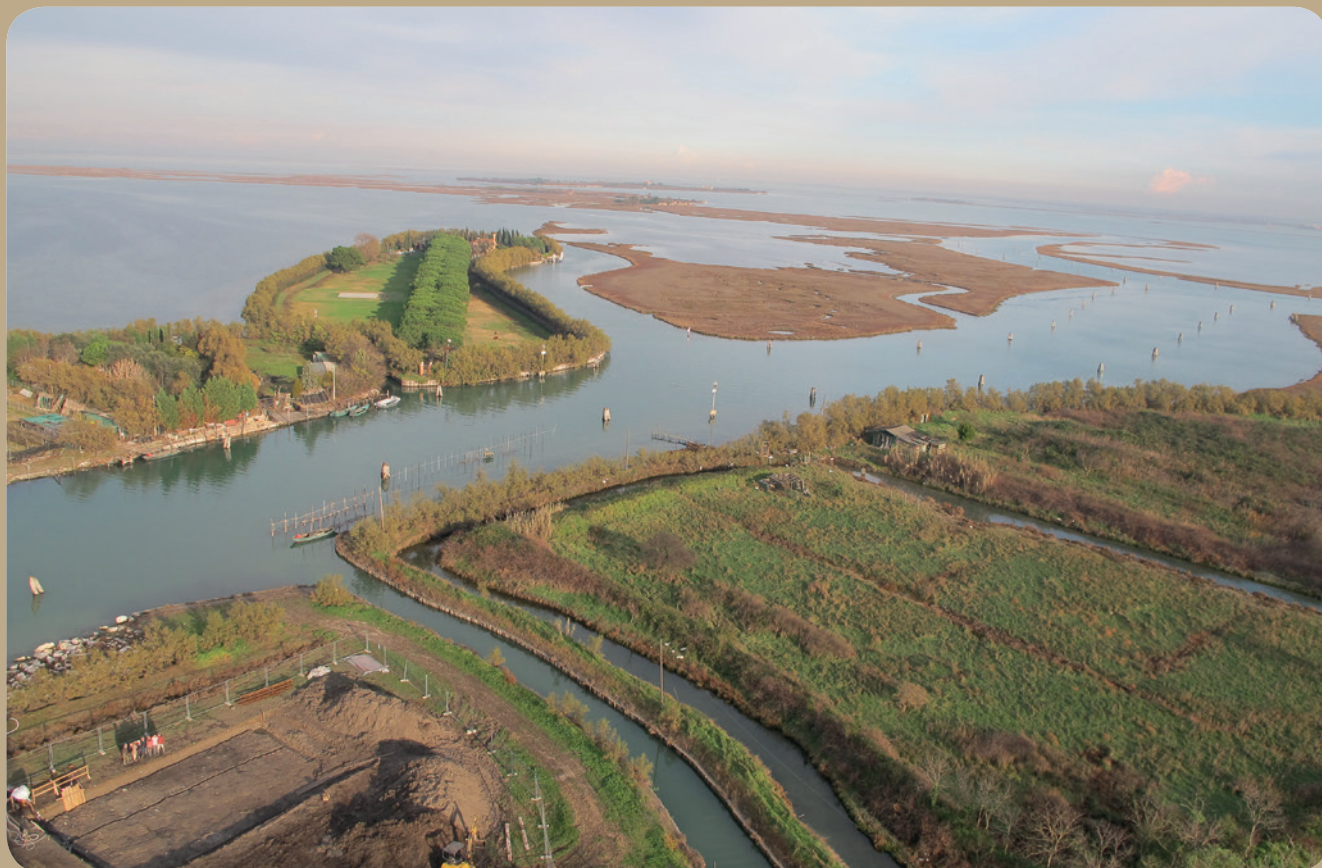
Fig. 7 - Torcello, vista dal campanile (D. Calaan)