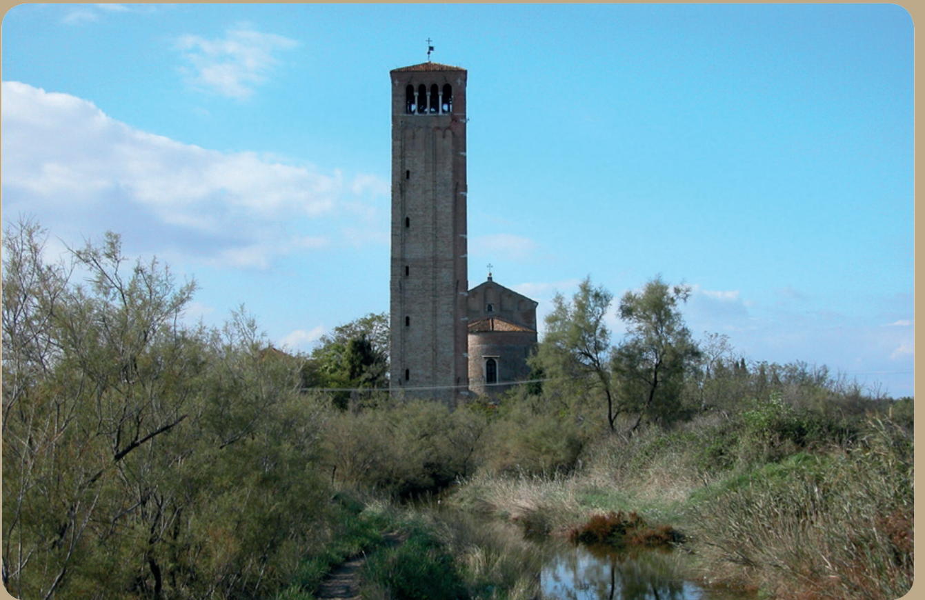
Fig. 3 - Santa Maria Assunta, vista dalla zona sud-orientale (D. Calaon)