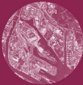
Parco Scientifico Tecnologico - VEGA