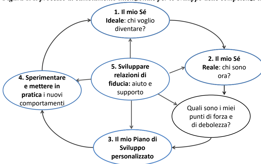
Figura 1. Il processo di cambiamento intenzionale per lo sviluppo delle competenze trasversali

Con riferimento alle modalità di erogazione del percorso formativo, oltre agli incontri in presenza, saranno previste attività on-line tramite l'utilizzo della Competency Platform, piattaforma digitale progettata dal Ca' Foscari Competency Centre a supporto dell'attività in presenza (figura 2).