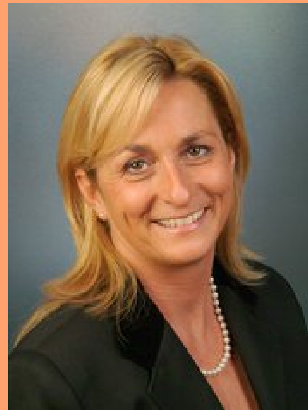
PRESIDENTE Canaletto Intermediazioni srl

Bisogna saper ascoltare, raccogliere informazioni, avere empatia e soprattutto professionalità per lavorare in team e valorizzare le competenze. Crede fermamente nell' importanza delle Istituzioni e ritiene sinergica la collaborazione per una crescita soprattutto culturale del nostro Paese.