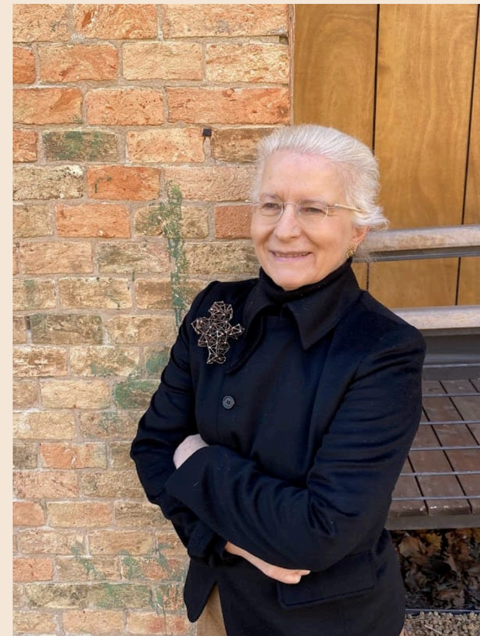
ARCHITETTO E CURATRICE Fondazione dell'Albero d'Oro, Palazzo Vendramin Grimani

Dal 2007 al 2019 è stata direttrice del Museo Fortuny di Venezia. Oggi è parte del Consiglio di Amministrazione della Fondazione dell'Albero d'Oro presso Palazzo Vendramin Grimani.