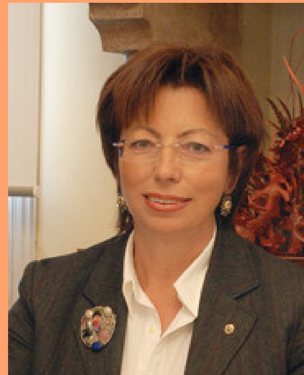
NOTAIO Studio Notarile