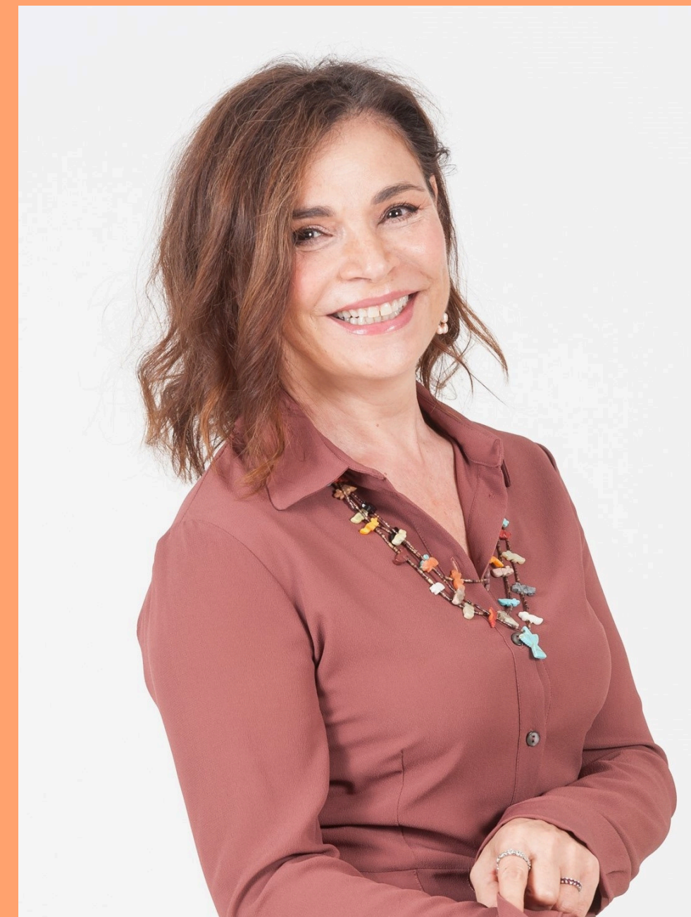
SENIOR ADVISOR Workup Neosperience Spa

In seguito lavora come consulente di Project Management presso grandi aziende italiane. Nel 1996 è socia fondatrice della digital company Workup , della quale è stata amministratore delegato dal 2001 al 2023. Nel 2020, Workup entra a far parte del gruppo Neosperience spa , uno dei principali player nel settore della Digital Customer Experience , quotata su AIM Italia.