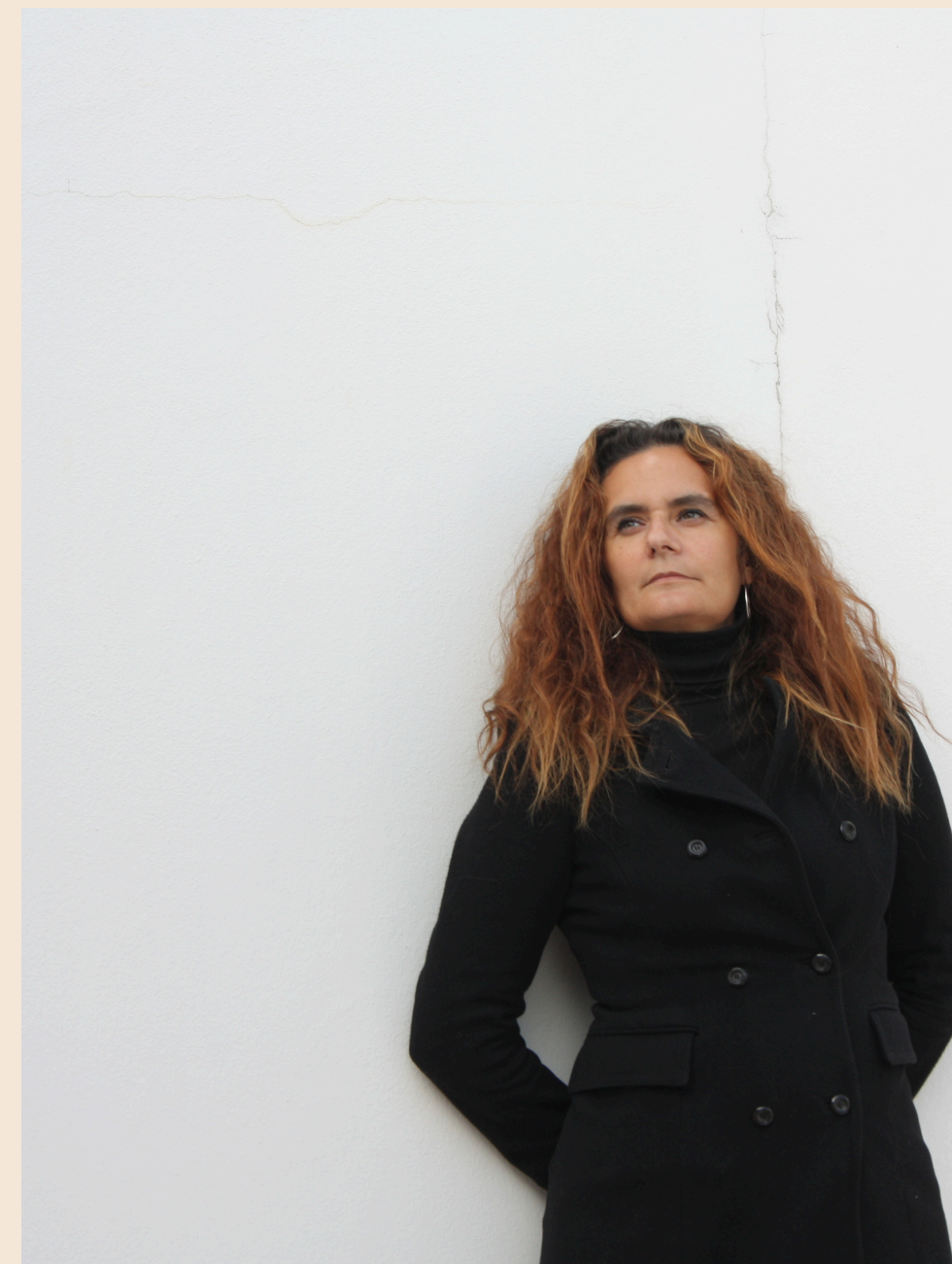
DIRETTORE ARTISTICO Fondo Plastico

Dal 2023 è direttore di cArte – Museo diffuso della Carta e della Stampa di Venezia.