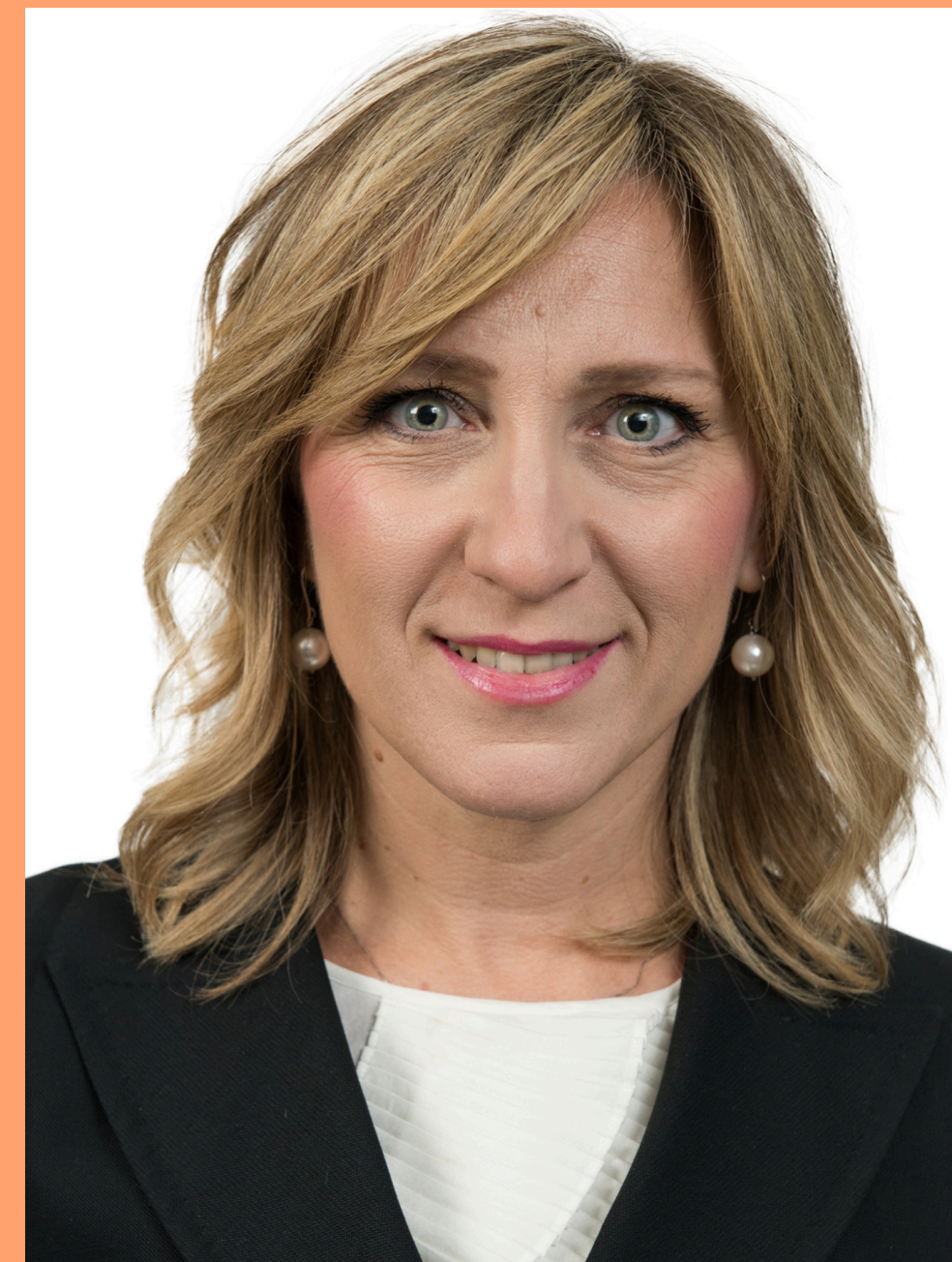
AVVOCATO E PARTNER CBA Studio Legale e Tributario

È accreditata da Chambers & Partners (Europe, Global), Legal 500 e Best Lawyers , ed è inclusa in Leaders League per Patent e Trademark Litigation.